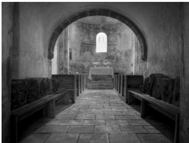
Kostel sv. Jakuba Většího v Rovné.

Kontakt: Klaudia Dorociaková, Klaudia.Dorociakova@seznam.cz , 608 515 045.