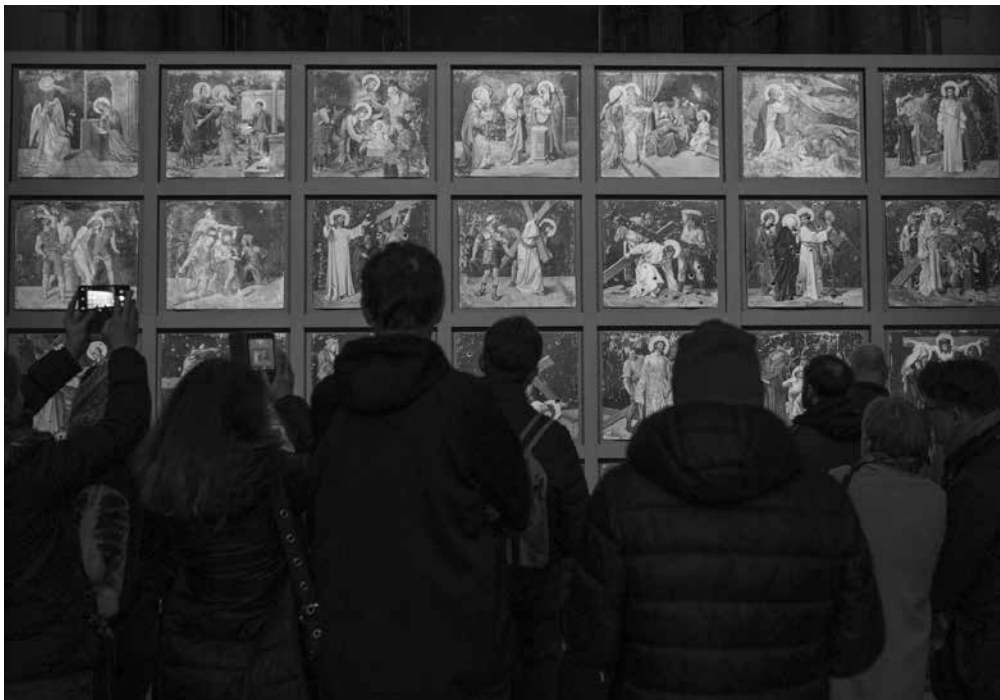
Křížová cesta z Krickerhau.

Křížová cesta z Krickerhau bude k vidění do neděle 9. června. V pátek 7. června ji tak budou moci shlédnout návštěvníci Noci kostelů.