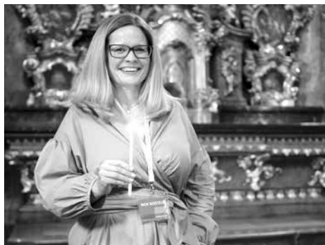
Jana Hrdličková.