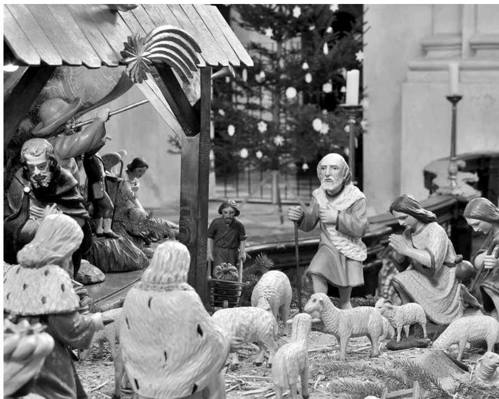
Ze salvátorského betléma.