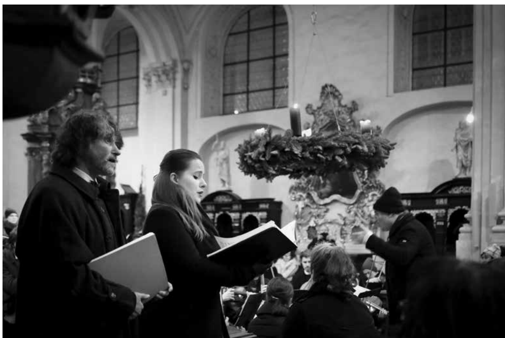
Z České mše vánoční Jakuba Jana Ryby v podání Sboru a orchestru Univerzity Karlovy.