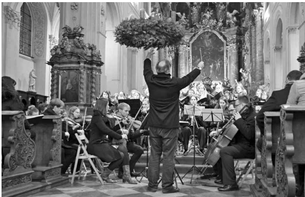
Z Rybovy mše vánoční v našem kostele.