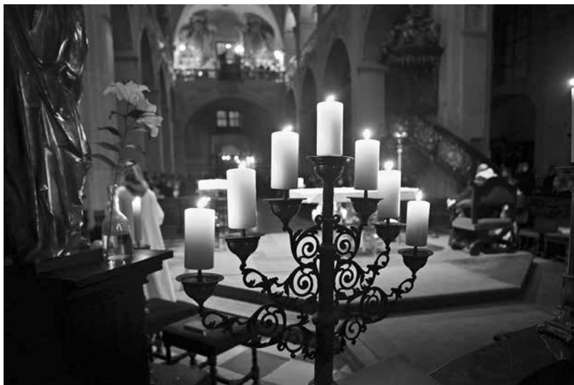
Z letošního Requiem.