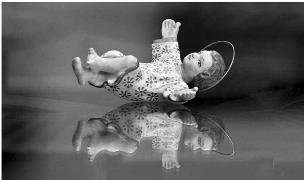
Ježíšek z našeho betléma.