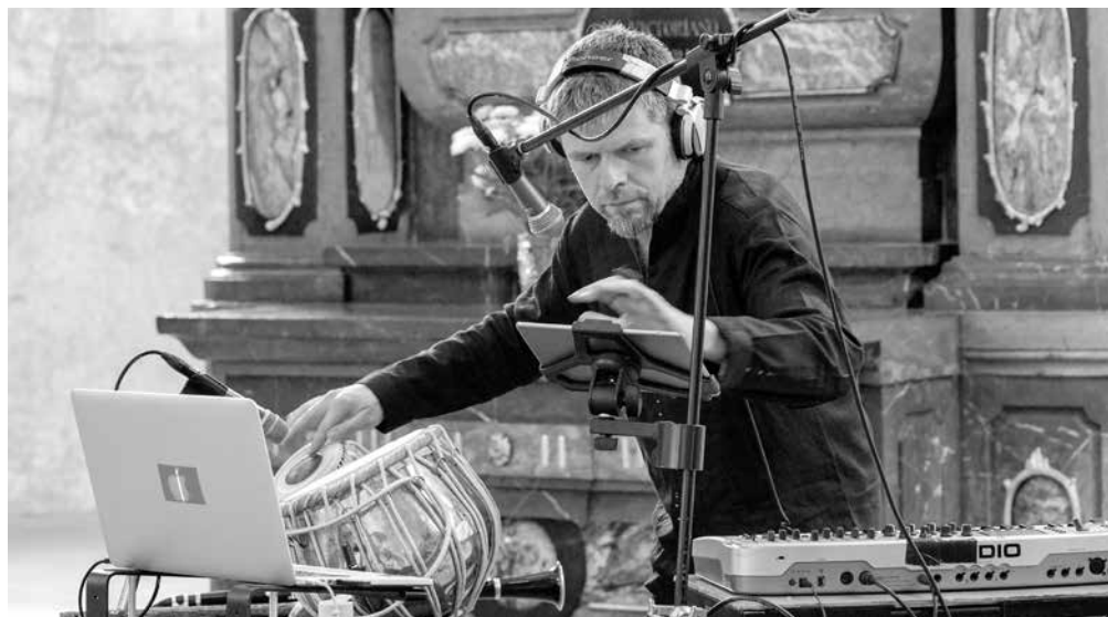
Koncert Trans Organic.

Vstupenky je možné zakoupit přímo na místě nebo v předprodeji v síti GoOut.