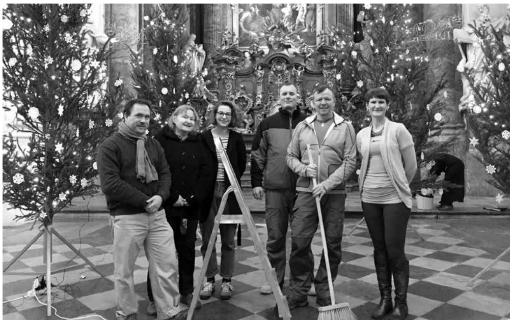
Z předvánoční stavby betléma a zdobení stromů.