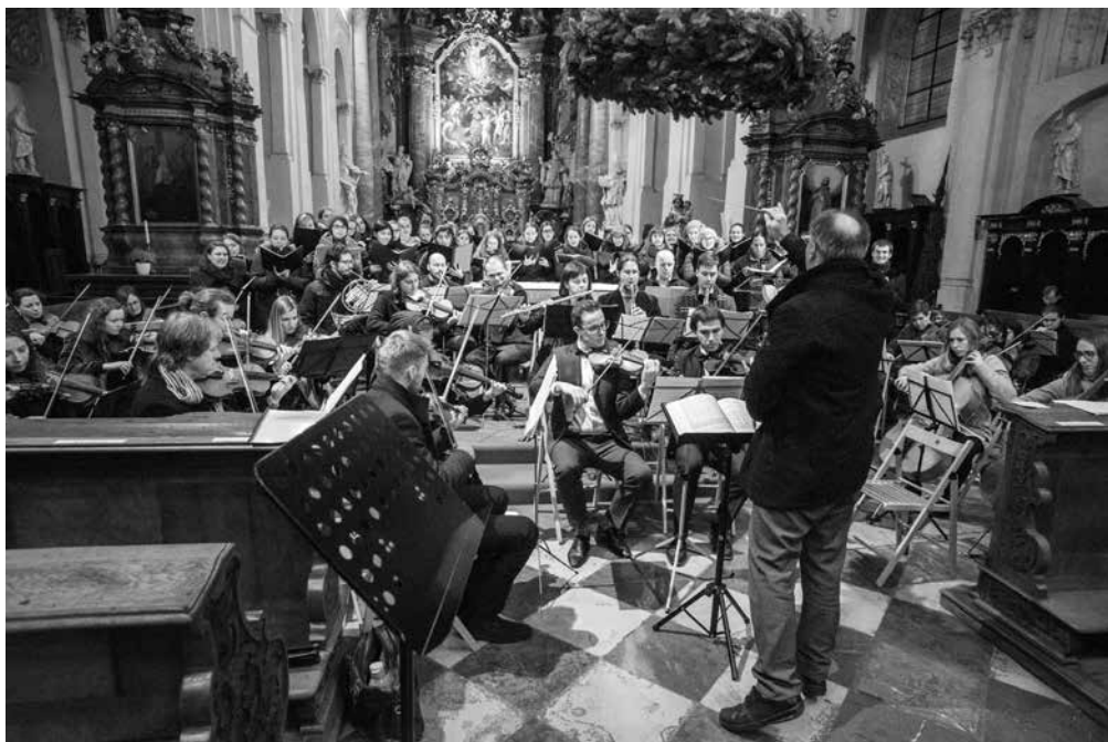
Z benefičního koncertu sboru a orchestru UK.