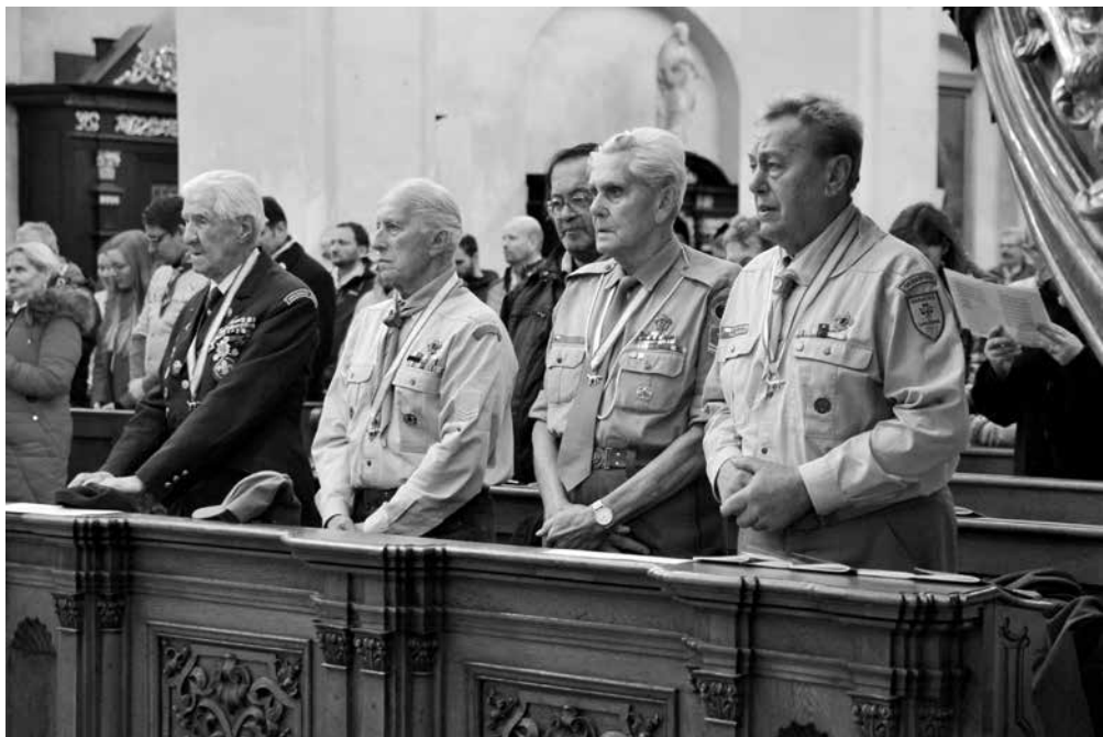
Ze slavnostní mše sv. ke třicetiletí obnoveného skautingu.