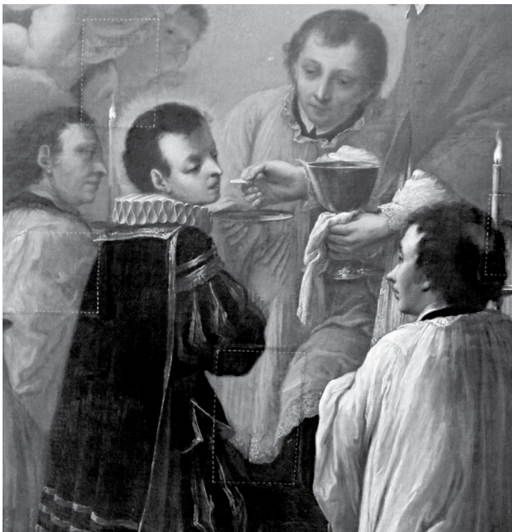
Sv. Alois Gonzaga – patron všech studentů