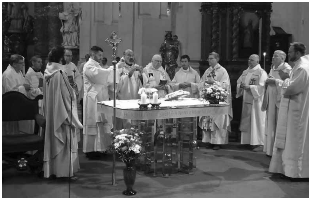
Veni Creator – slavnostní mše k zahájení akademického roku 1. října 2019