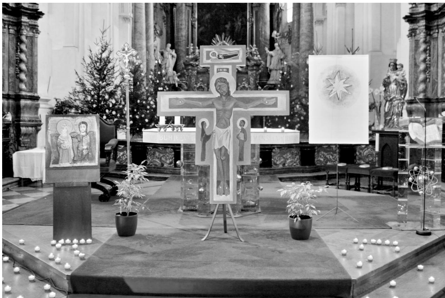
Ze setkání Taizé v našem kostele