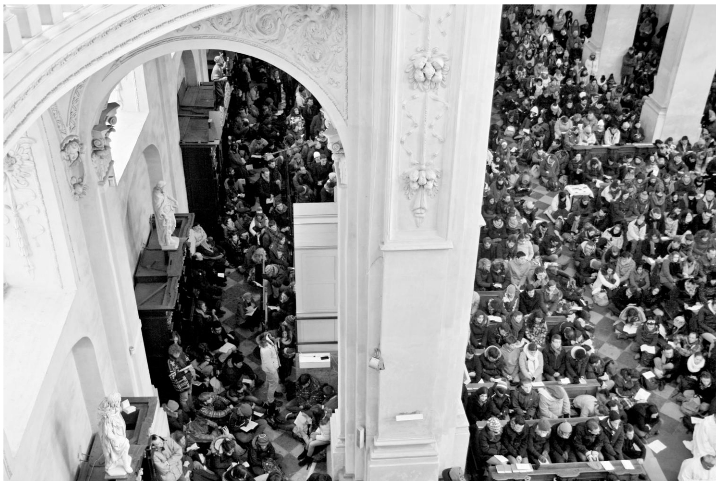
Ze setkání Taizé v našem kostele