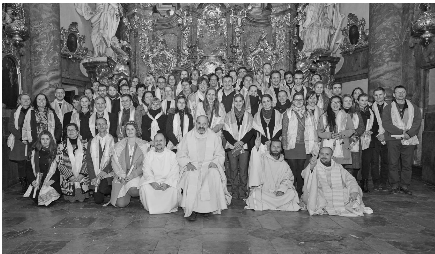
Letošní „vrh“ šedesáti o Vigilii pokřtěných. Ad Maiorem Dei Gloriam!