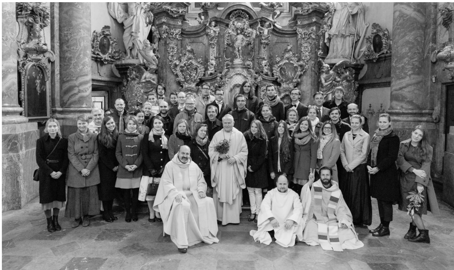
Letošní „vrh“ pětatřiceti biřmovaných. Ad Maiorem Dei Gloriam!