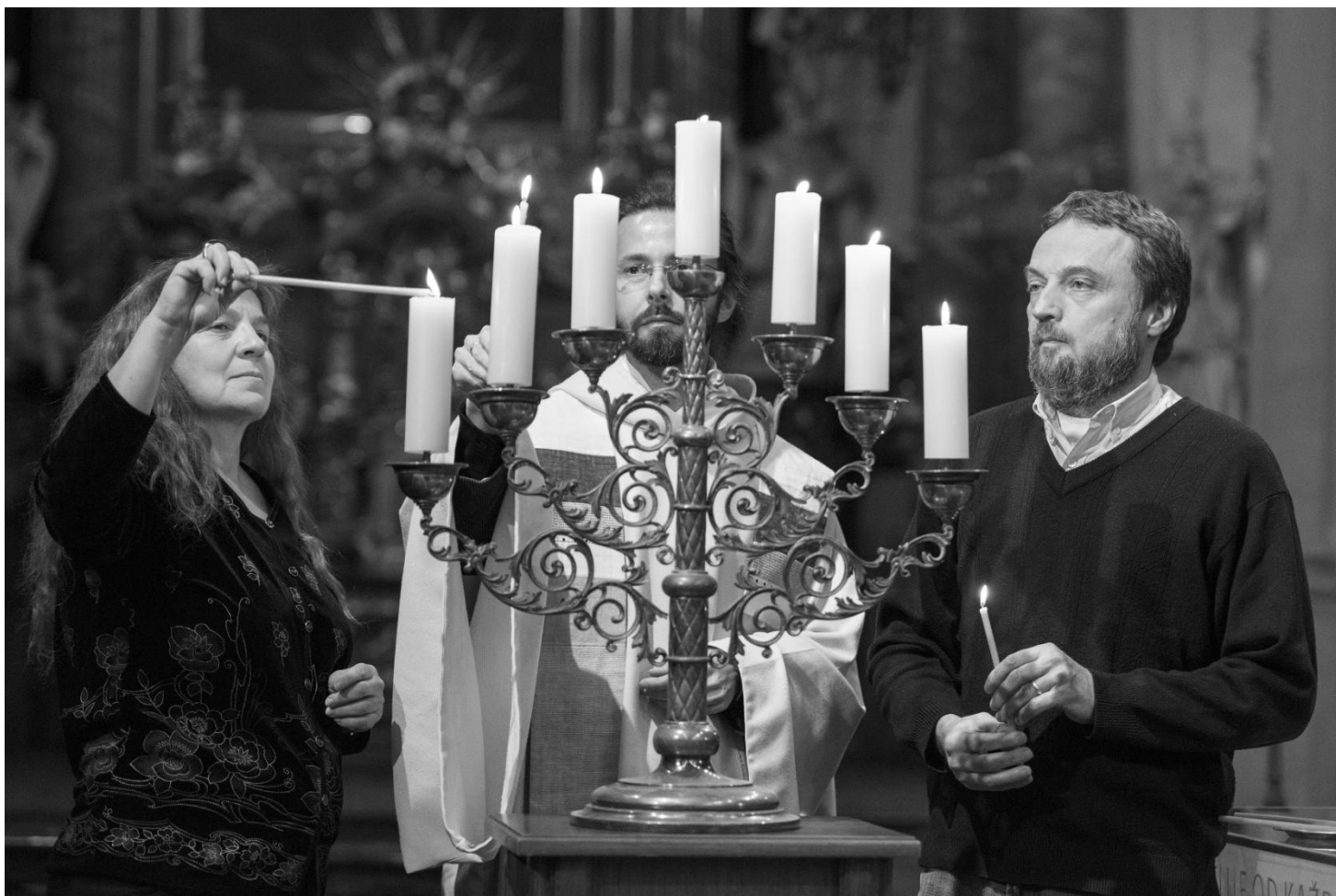
Z mezináboženského setkání Společný hlas v našem kostele

Další výlet spolku Cesta se bude konat v lednu a dočtete se o něm v lednovém vydání Salvatore.