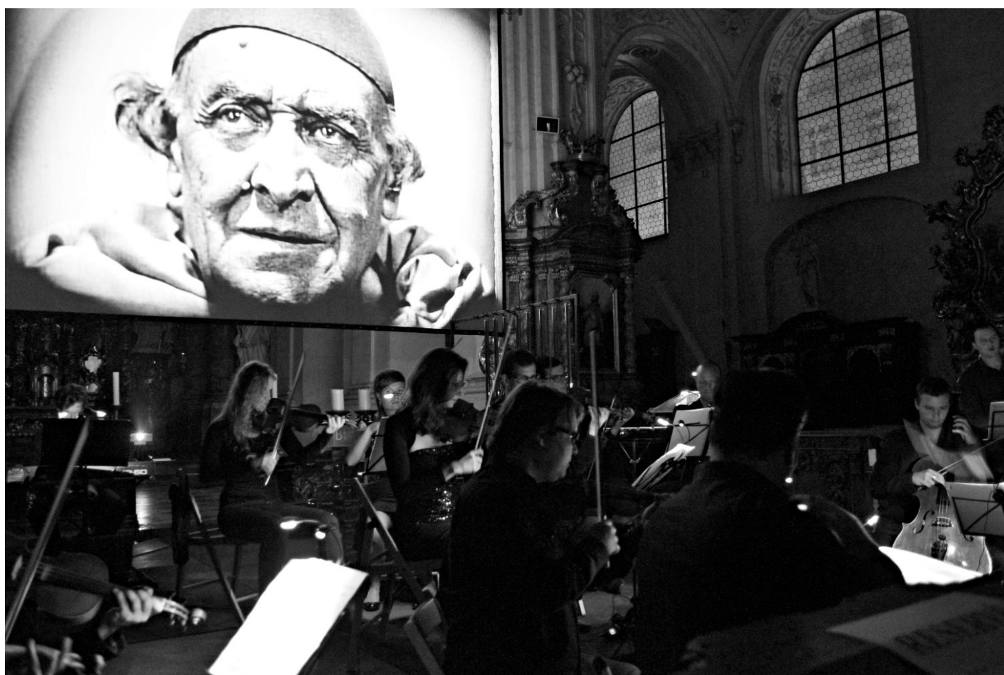
Projekci filmu živě doprovodil orchestr Berg