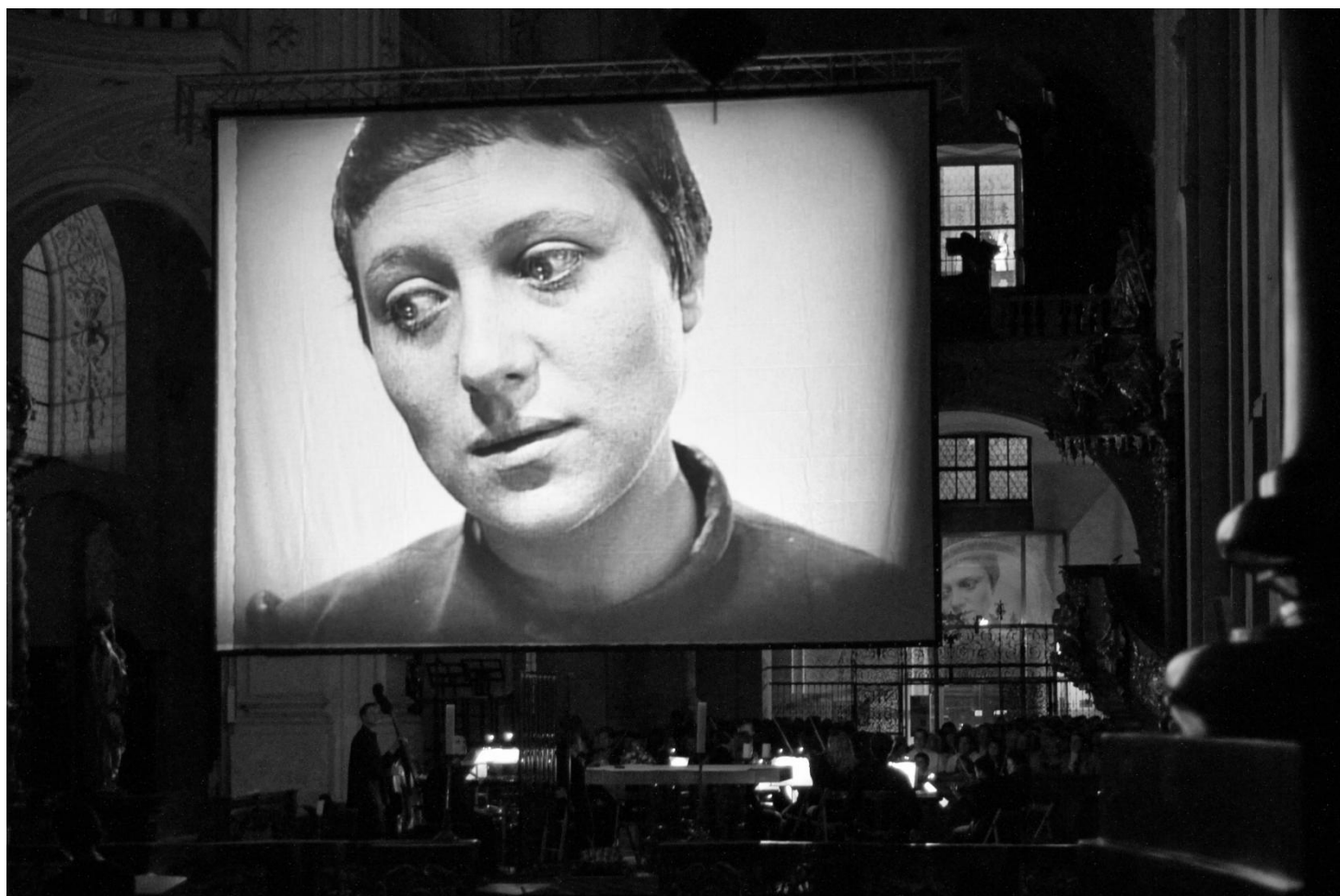
Panna Orleánská navštívila náš kostel v září