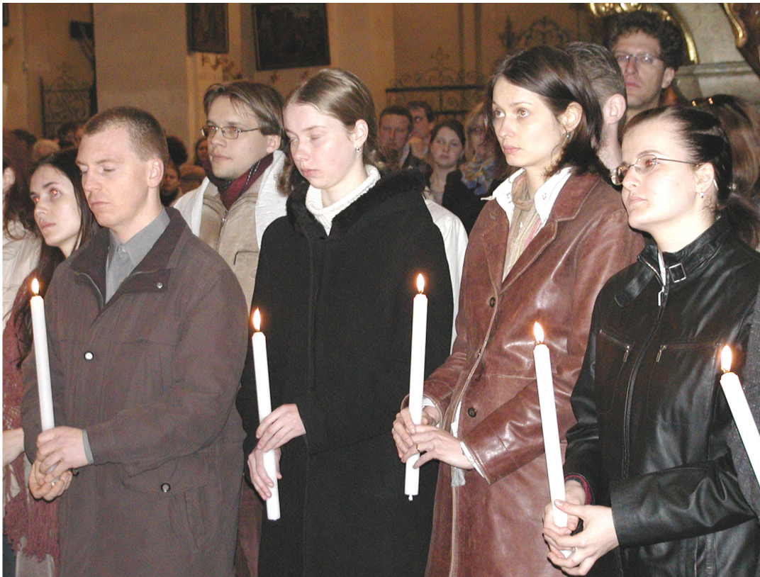
Z biřmování 3.dubna 2005 (více fotografií na www.salvator.farnost.cz )