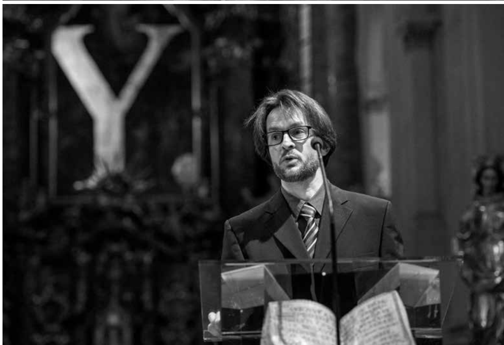
Z letošního Popelce umělců, foto Petr Neubert