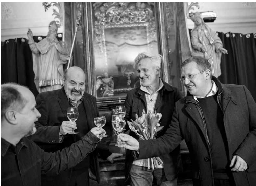
Z letošního Popelce umělců