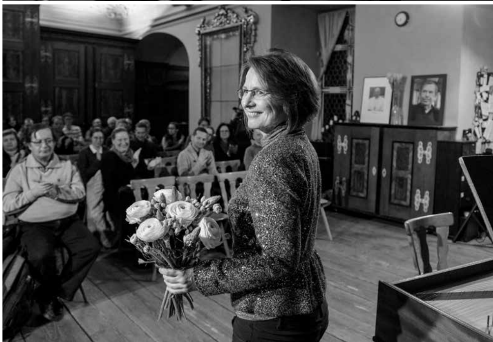
Z letošního Popelce umělců