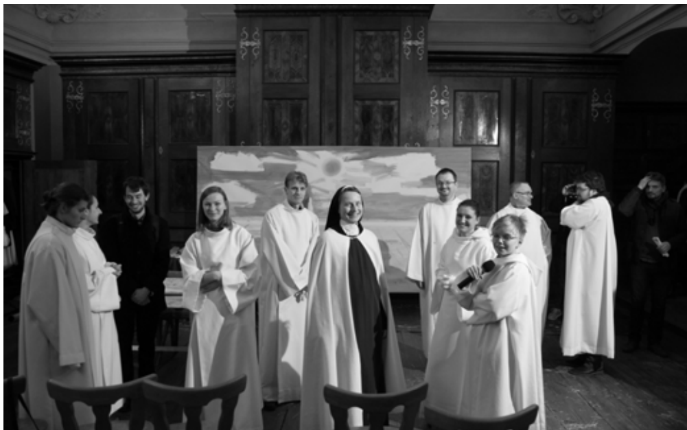
Z Popelce 2017