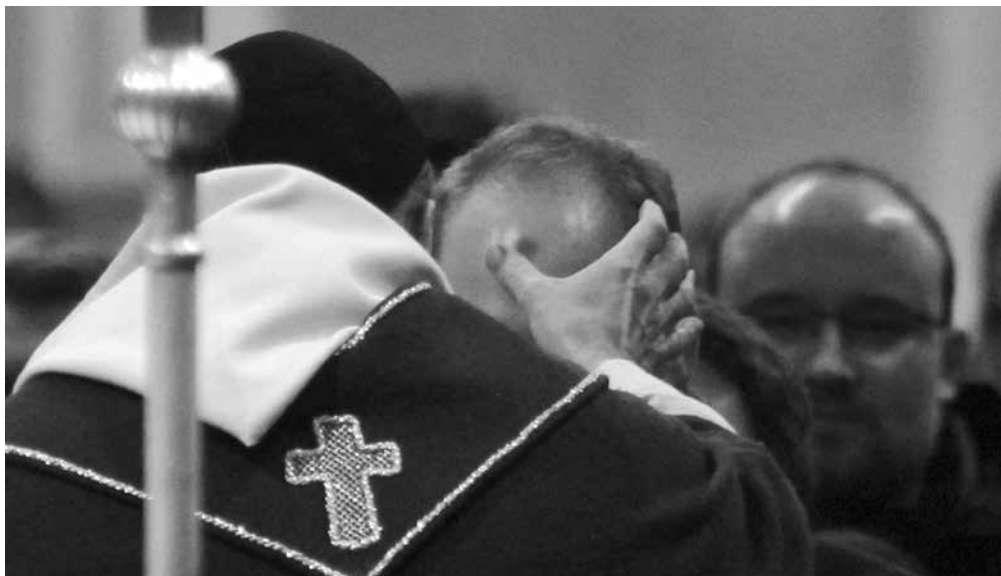
Z Popelce 2017