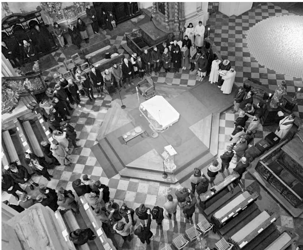
Vstup mezi čekatele křtu.

O všech následujících postních nedělích se nad katechumeny budeme během večerních mší modlit a vyprošovat jim kajícího ducha, odvahu a radost. S některými z nich (a společně s nimi i s kandidáty biřmování) se setkáme ještě v rámci posledního setkání v Kolínském klášteře. A na Bílou sobotu večer, tedy při Velikonoční vigílii nás čeká velké finále, tedy křest, biřmování a první přijímání.