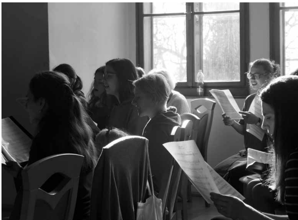
Zpěvačky na podzimním soustředění scholy ve Štětkní.