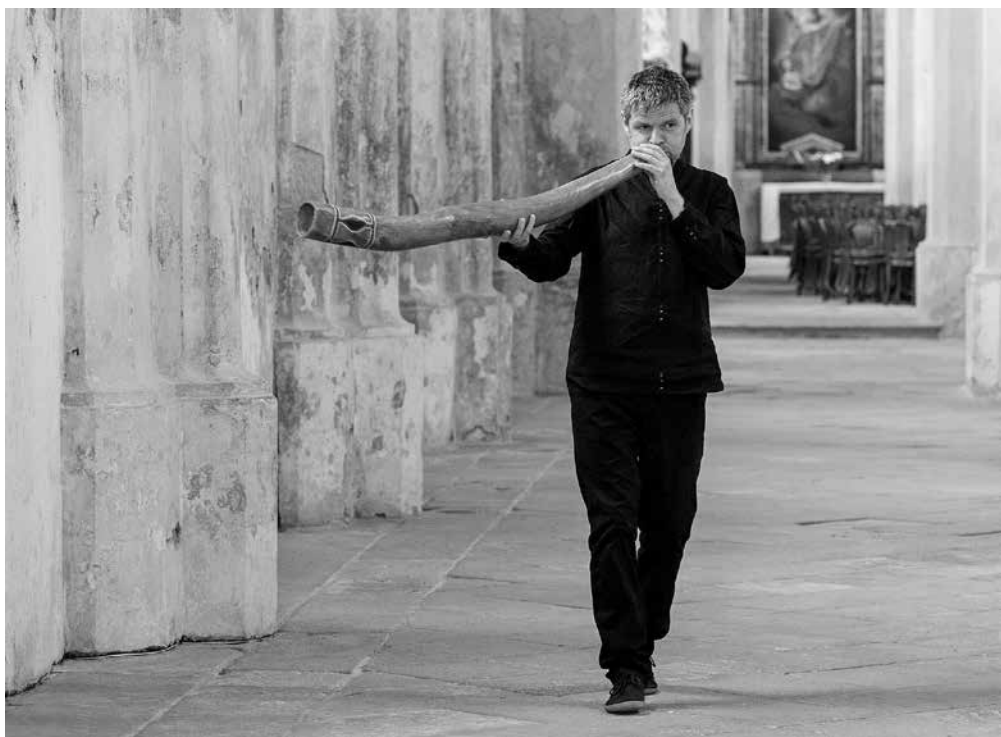
V sobotu 17. 12. uslyšíte u Salvátora projekt Trans Organic.