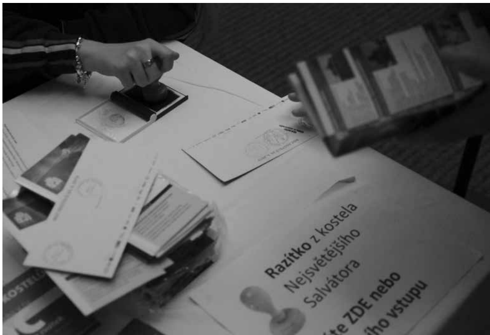
Z Noci kostelů 2019.