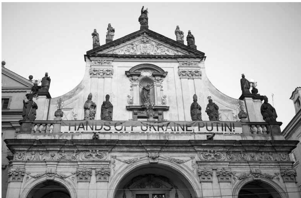
Kostel Nejsv. Salvátora s transparentem navrženým Robertem V. Novákem.