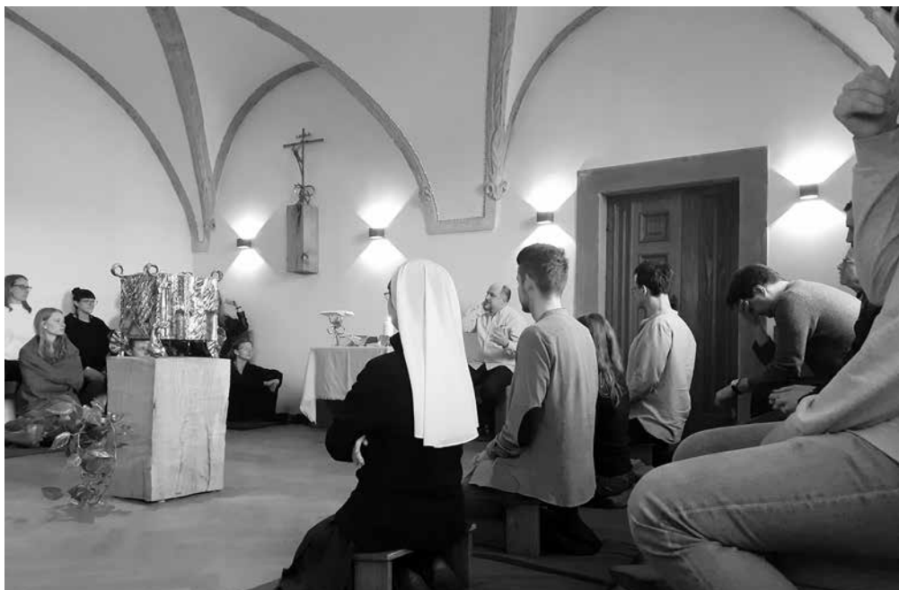
Kurz základů víry na Fortně, mše v sobotu 26. března 2022.