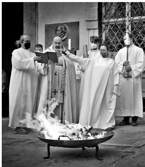
Z velikonoční vigilie.

Začíná se stejně jako na Květnou neděli na studentském nádvoří Klementina. U vchodu do našeho kostela i na nádvoří je možné si vyzvednout svíčku (můžete mít vlastní). Na nádvoří se světí oheň, od něj se zapaluje velikonoční svíce – paškál. Po příchodu se v kostele na trojí zvolání „Světlo Kristovo“ odpovídá „Sláva Tobě, Pane“ a dále se pokračuje velikonočním chvalozpěvem ( Exsultet ), po němž následuje bohoslužba slova. Čte se devět čtení (sedm ze Starého a dvě z Nového zákona). Po sedmém čtení opět zazní varhany a zpívá se Gloria . Následuje čtení z epištoly, evangelium a kázání. Celé shromáždění obnoví své křestní vyznání. Letos se nekonají křty dospělých. Eucharistická bohoslužba probíhá obvyklým způsobem. Bohoslužba skončí před půlnocí.