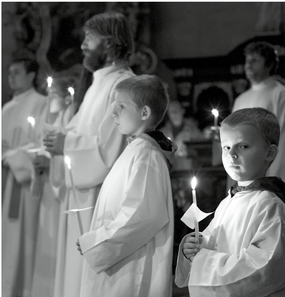
Z velikonoční vigílie v roce 2019.