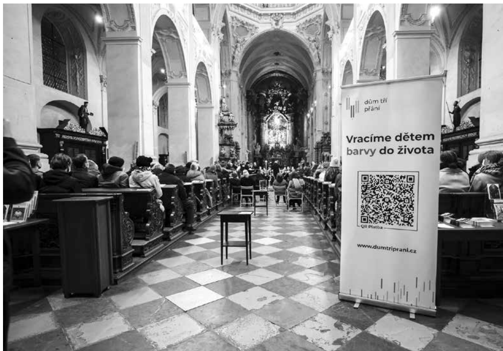
Z benefičního koncertu Sboru a orchestru UK.