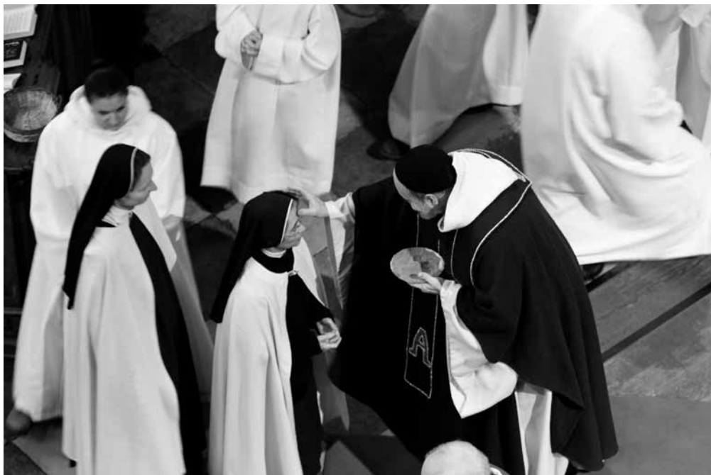
Z popeleční mše sv.