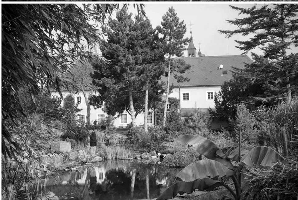
Exerciční dům a zahrada v Kolíně