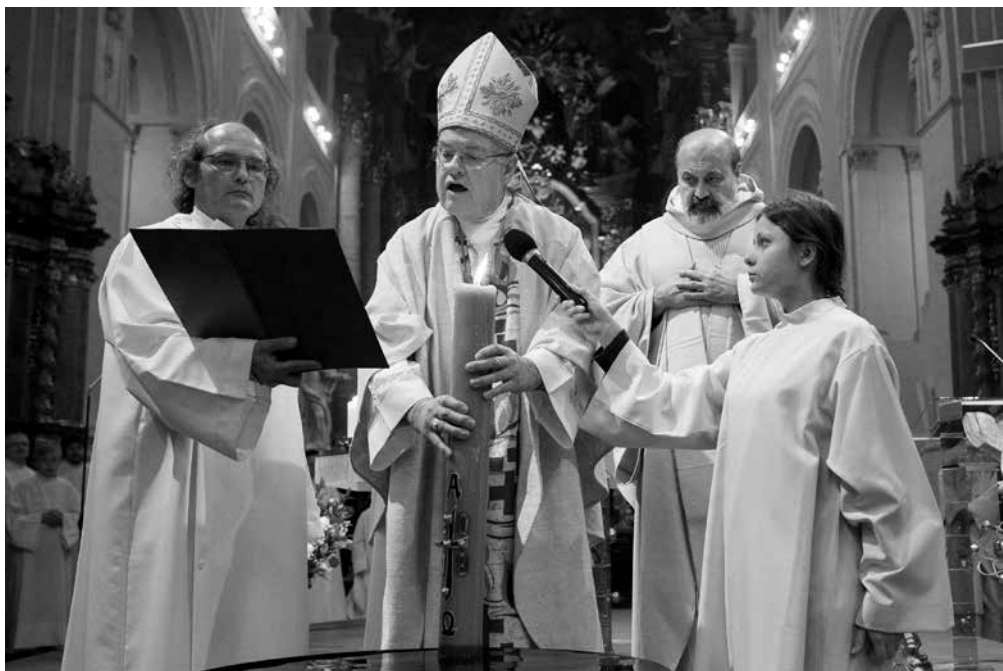
Velikonoční Vigilie