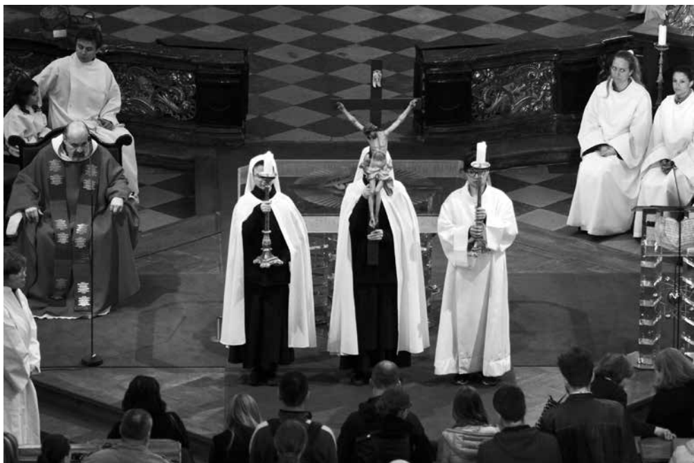
Velký pátek