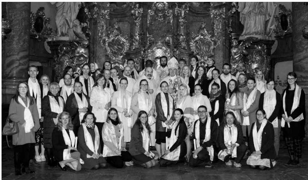
Novokřtěnci 2019