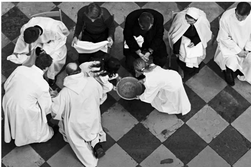
Zelený čtvrtek