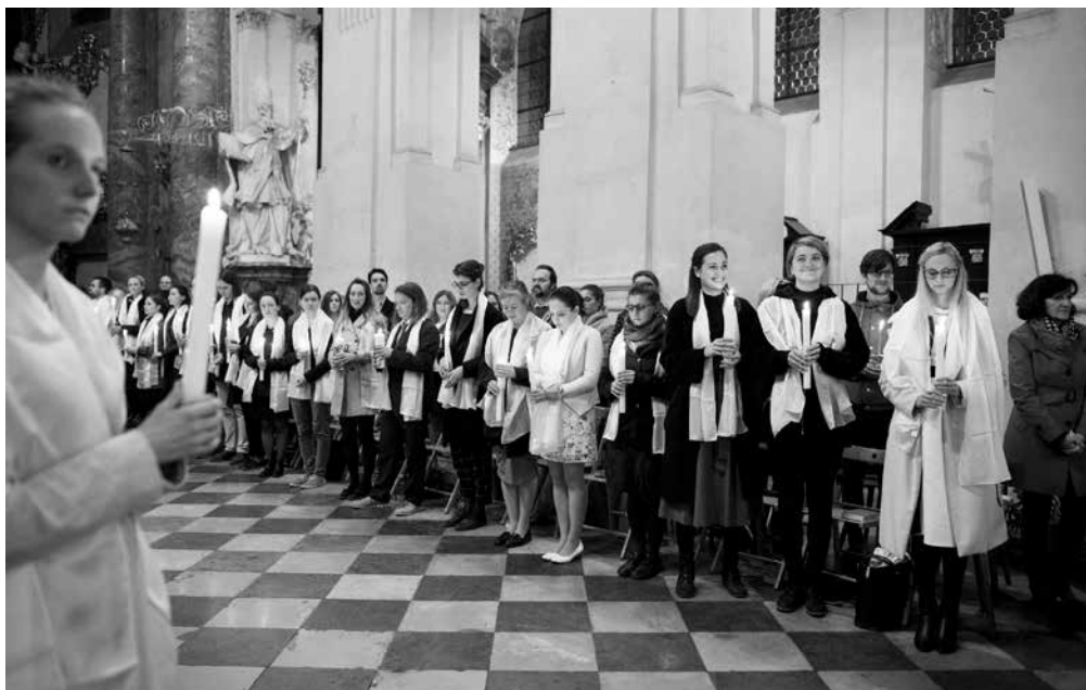
Novokřtěnci 2019