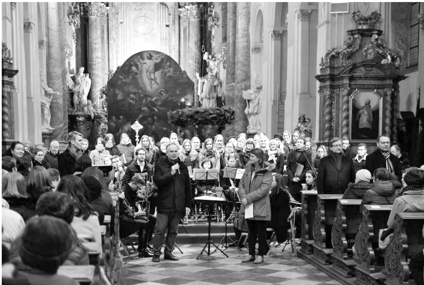
Z benefičního koncertu (Rybovy mše vánoční) Sboru a orchestru UK