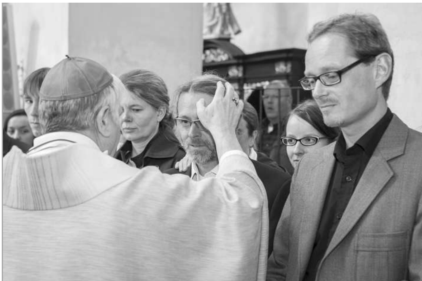
Biřmování 19.4. s Mons.Václavem Malým