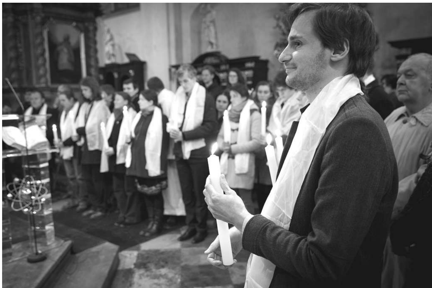
Křty - Velikonoční Vigilie