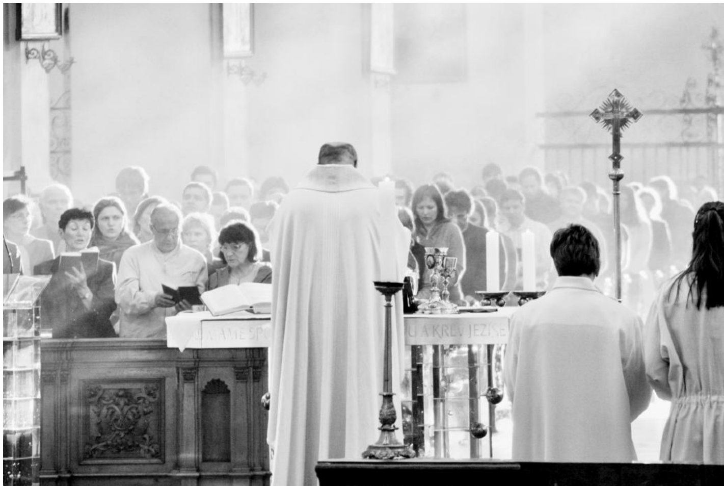
Ze salvátorského kalendáře 2015