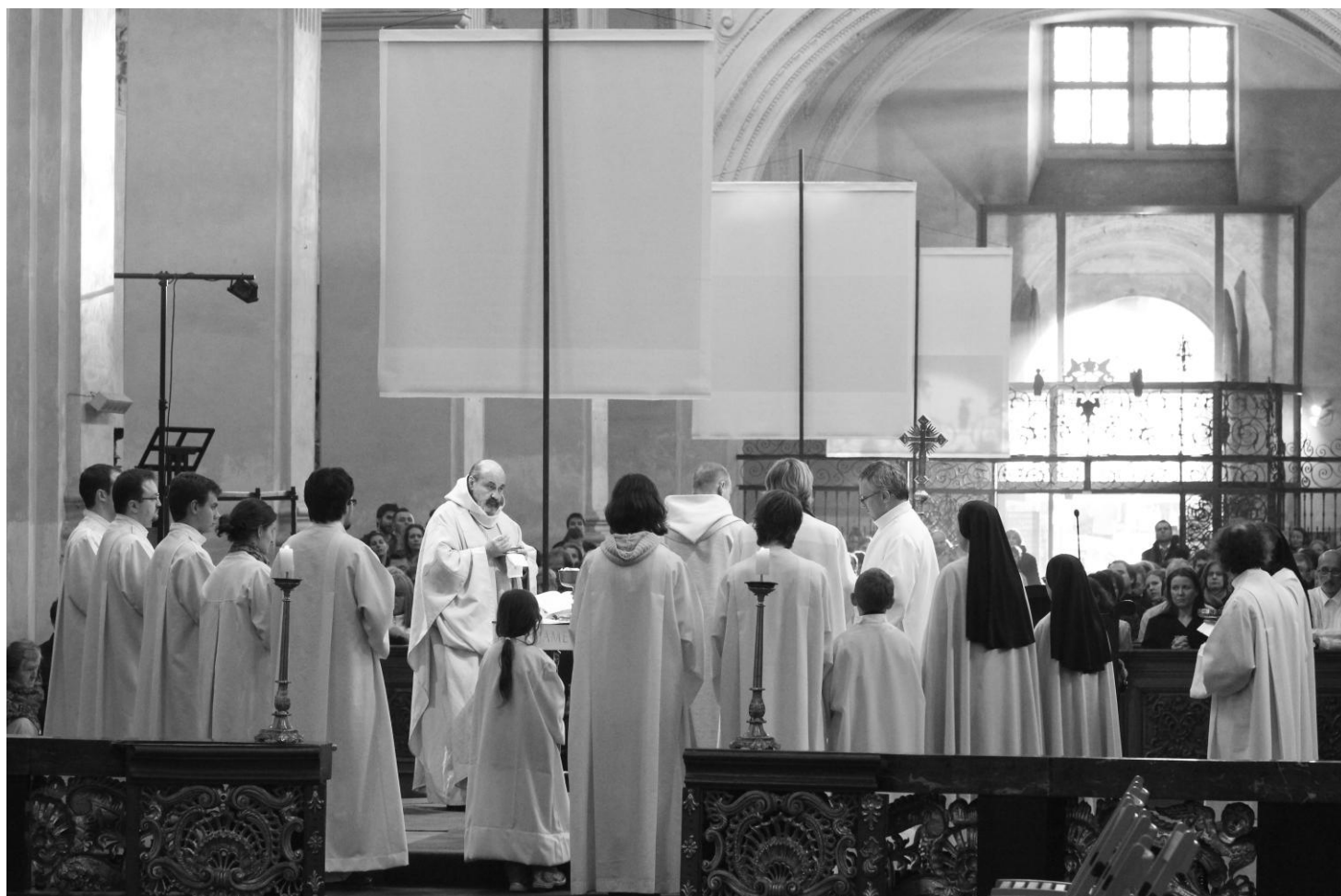
Z liturgie Zeleného čtvrtku