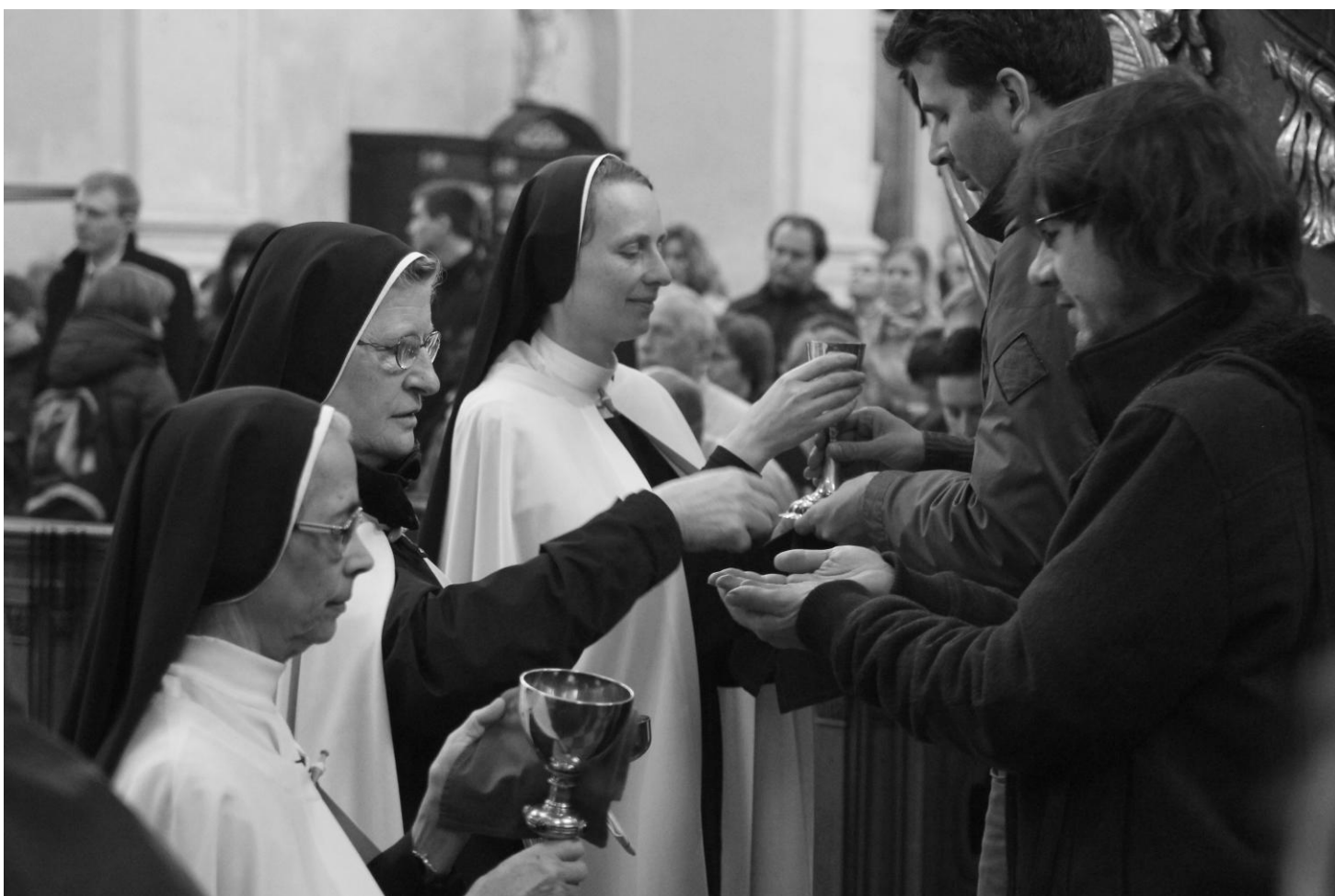
Z liturgie Zeleného čtvrtku