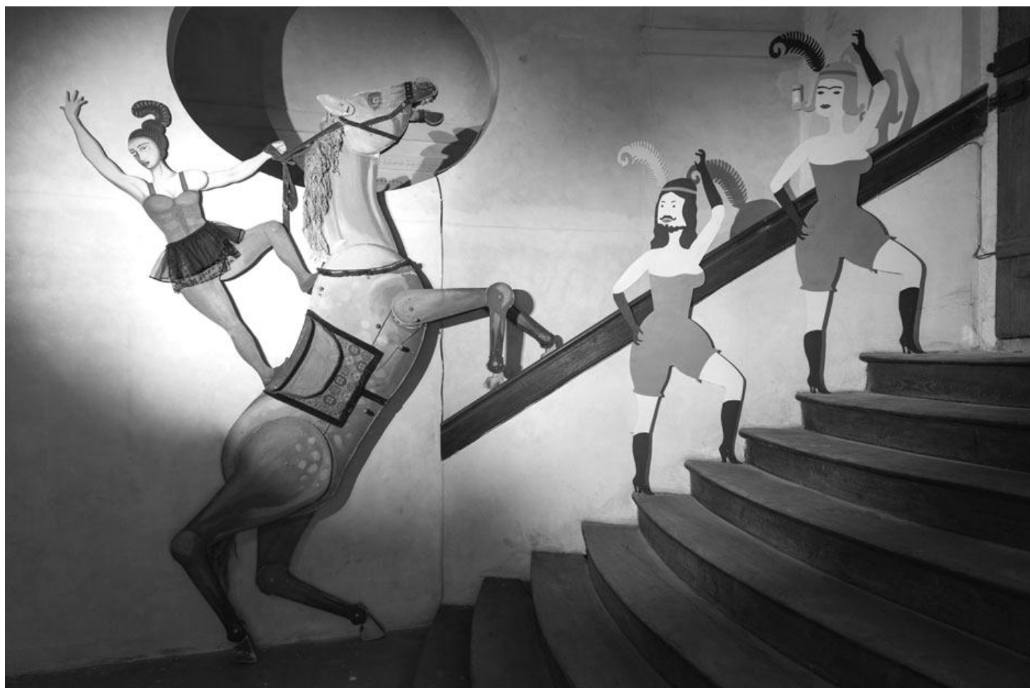
Z vernisáže a z výstavy Matěje Formana