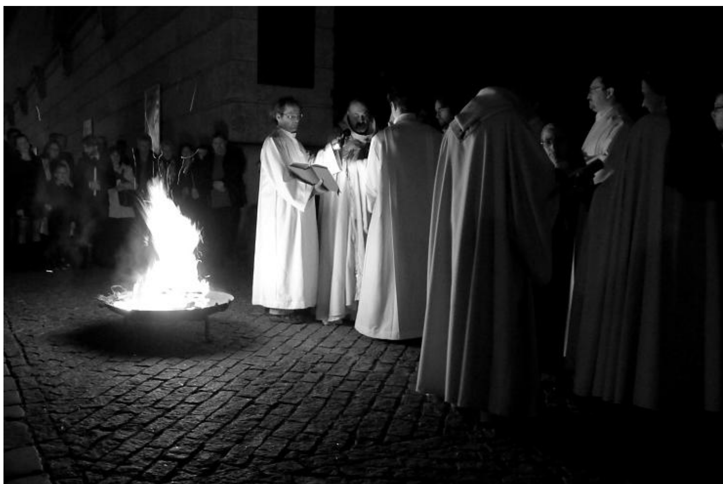
Z Velikonoční Vigilie