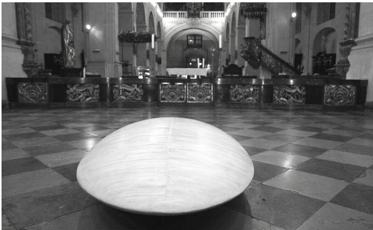
Instalace Jindřicha Zeithammla v presbytáři