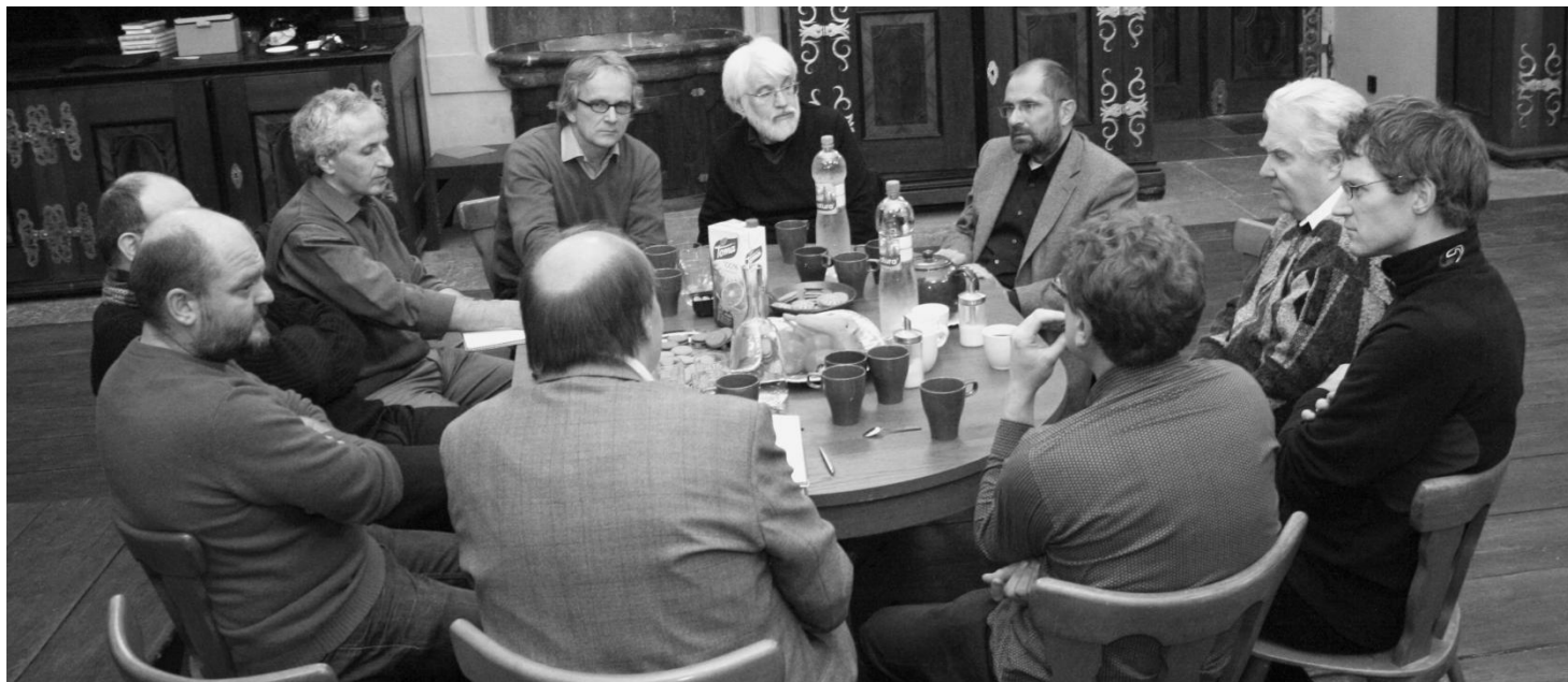
Debata s norskými partnery nad rekonstrukcí varhan