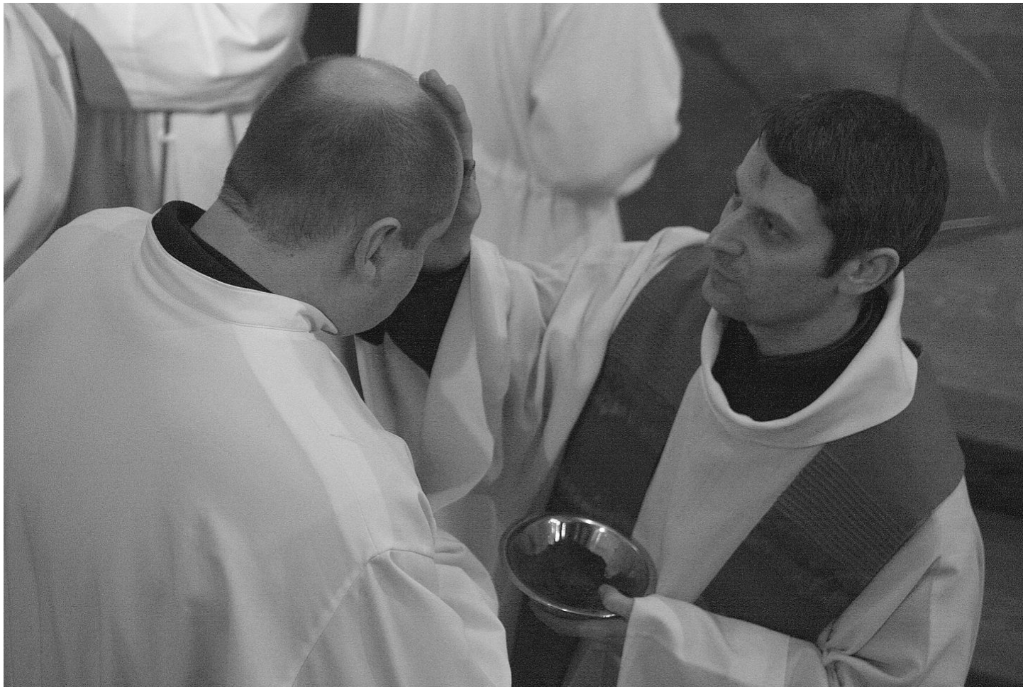
Z liturgie Popelční středy