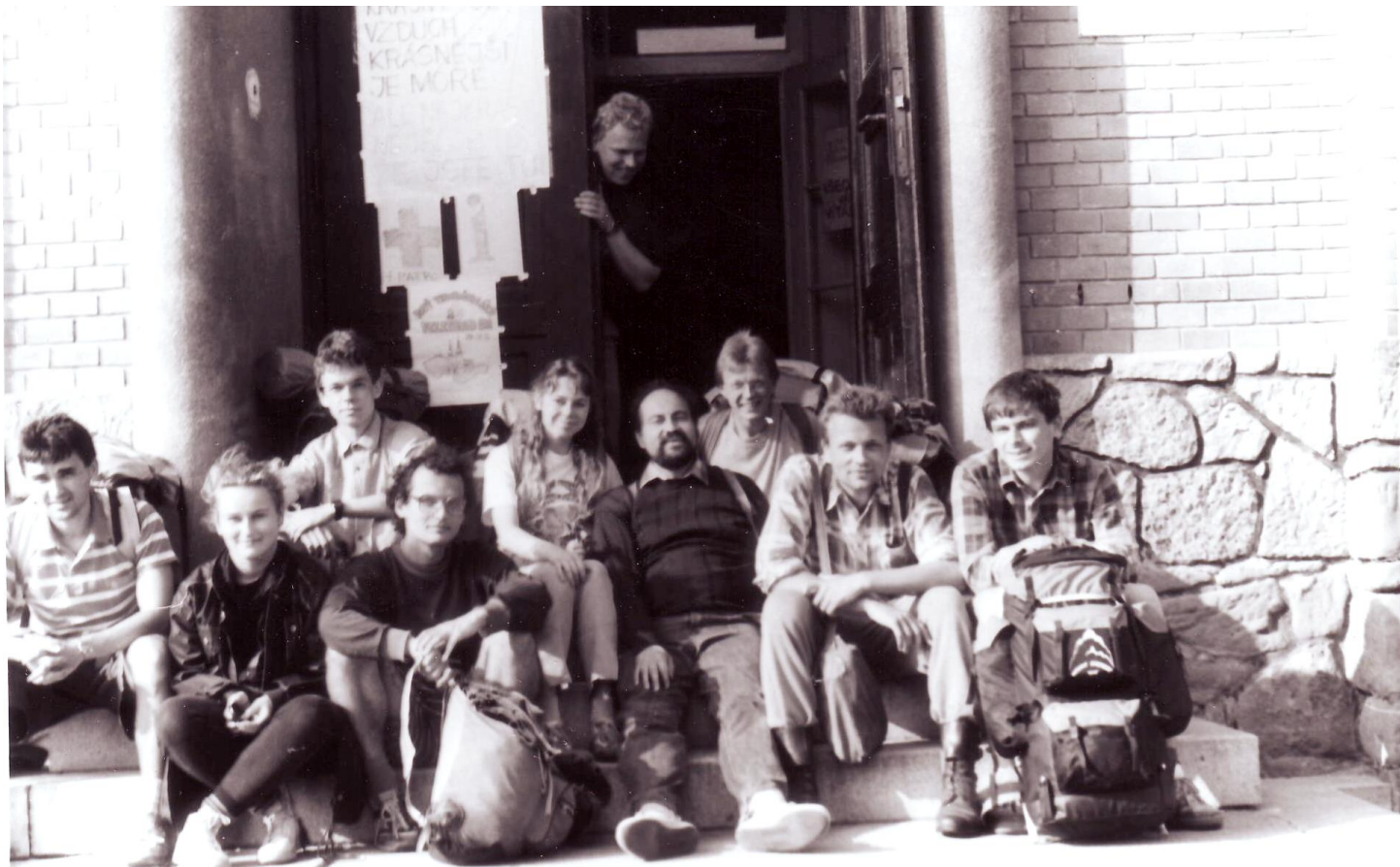
Foto ze studentského Velehradu 1992