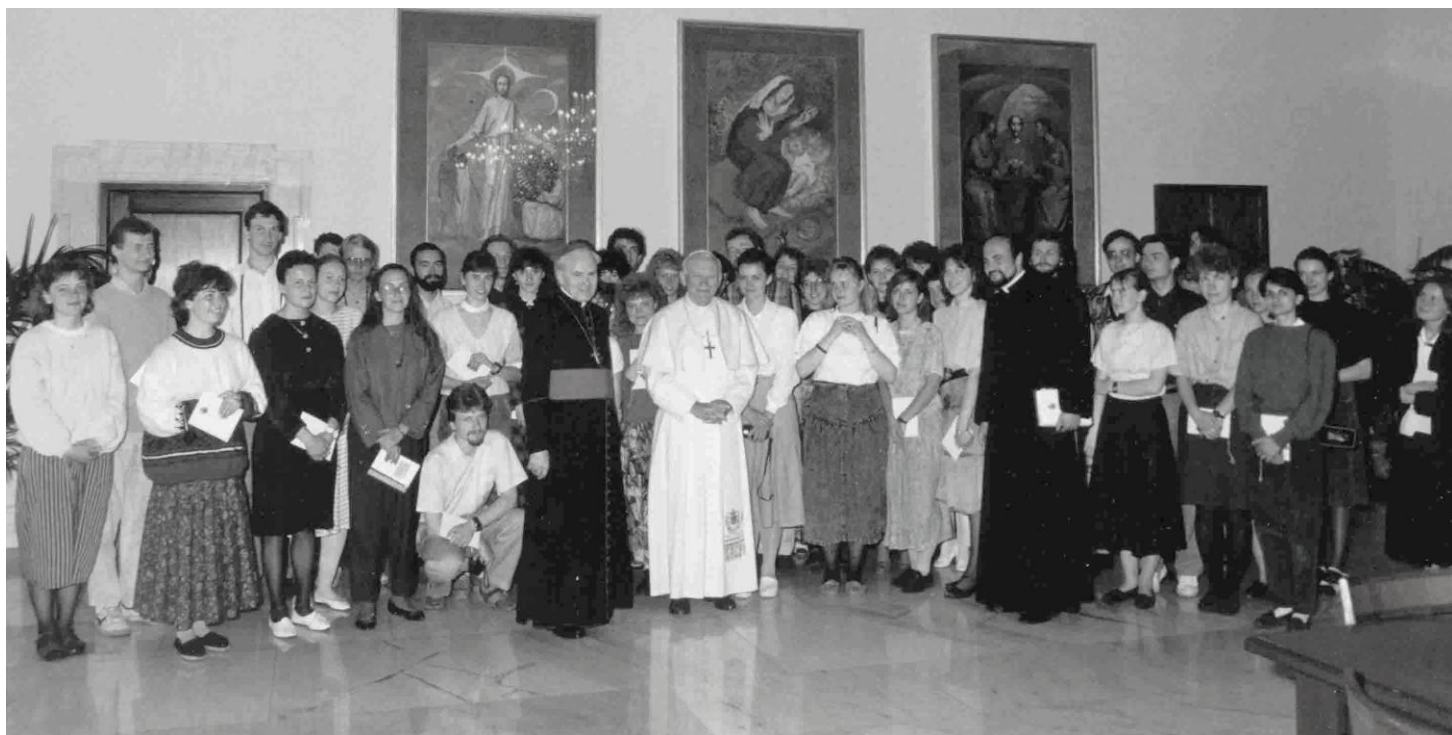
Tomáš Halík a salvátorští na audienci u papeže Jana Pavla II. v roce 1990

U příležitosti výročí vyjde v dohledné době sborník s názvem Salvatoria II – umění v kostele , který mapuje aktivity salvátorských umělců za posledních dvacet let. O vernisáži sborníku budeme informovat.