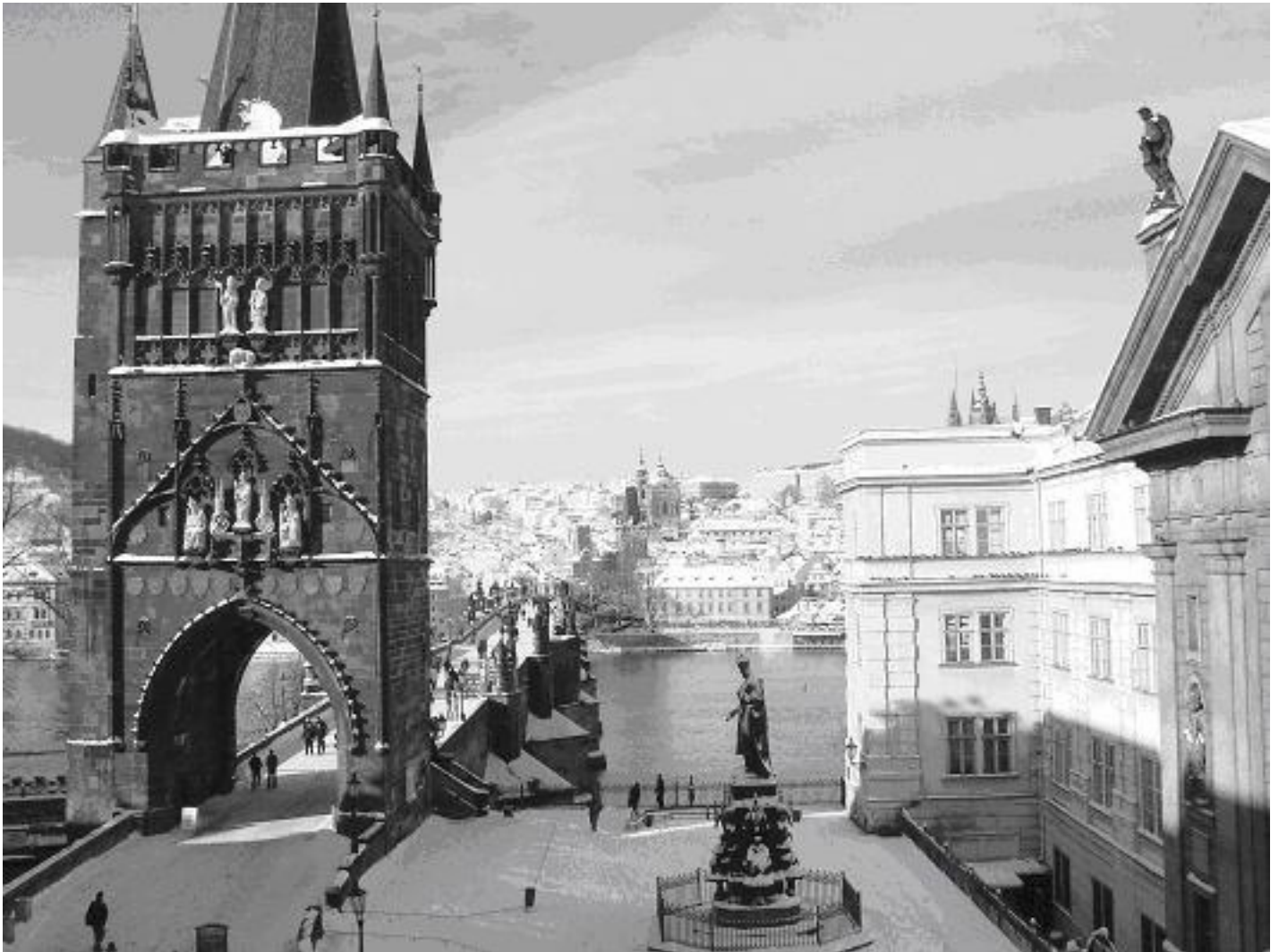
Ve čtvrtek 25.ledna jsem se zase kochal...