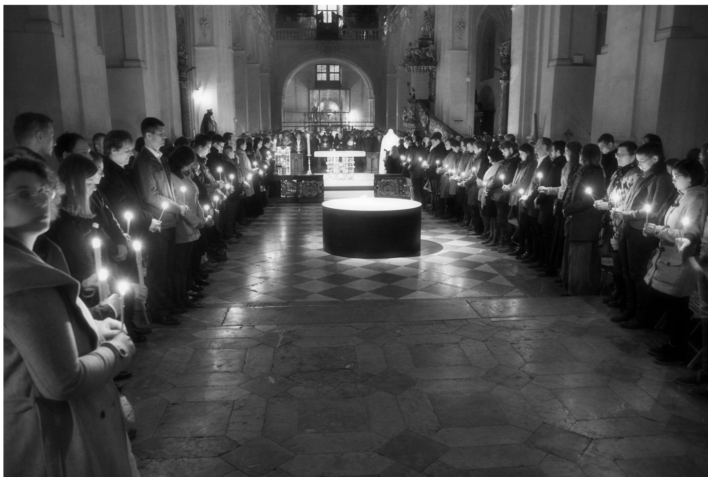
Z Velikonoční Vigilie 2017