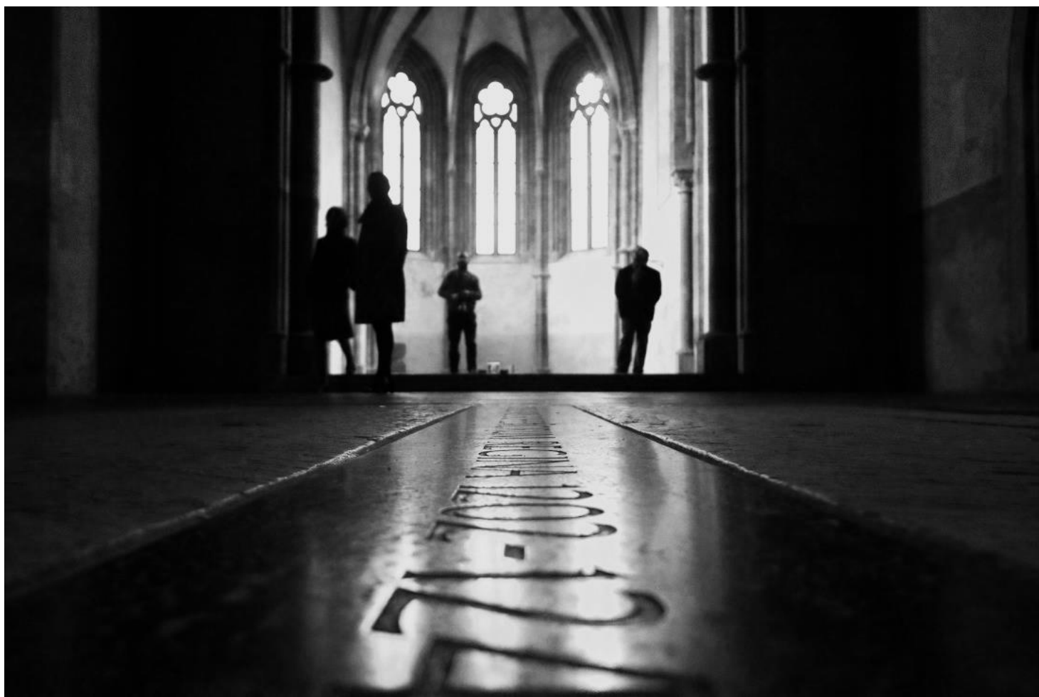
Z exercií Praha svatováclavská – Anežský klášter