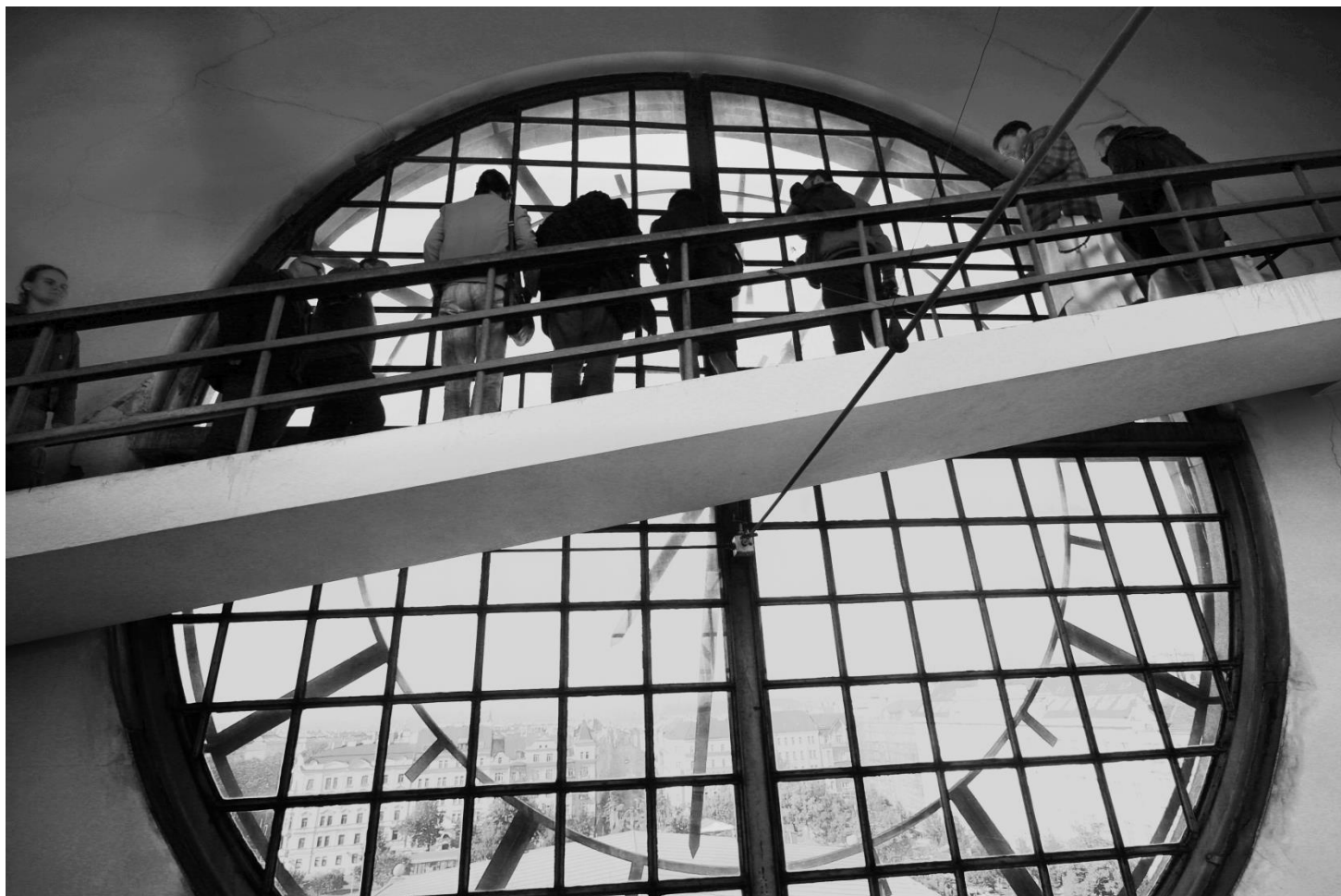
Z exercicií Praha svatováclavská – u hodin ve věži Plečnikova chrámu

Přihlašujte se emailem na adrese meditace@gmail.com a uvádějte v předmětu zprávy číslo kurzu. Prosíme, přihlašujte se na každý kurz samostatným emailem.