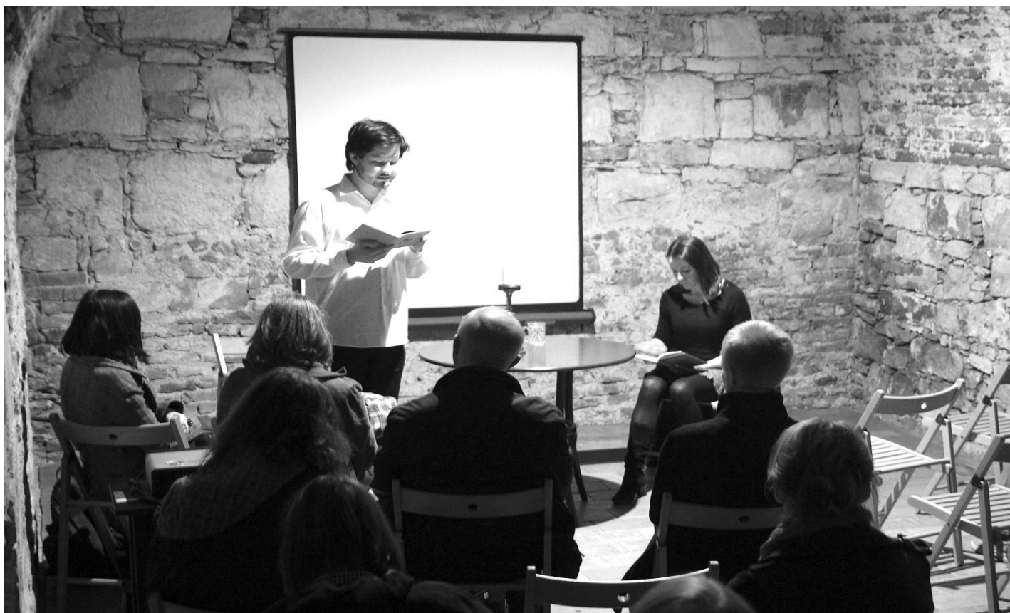
Čtení Písně písní v kryptě během Noci kostelů

Založili jsme facebookovou skupinu Kolínský klášter , kterou budeme používat jako jednu z platforem pro informace o dění v Kolíně. Pro kontakt a informace používejte adresu meditace@gmail.com