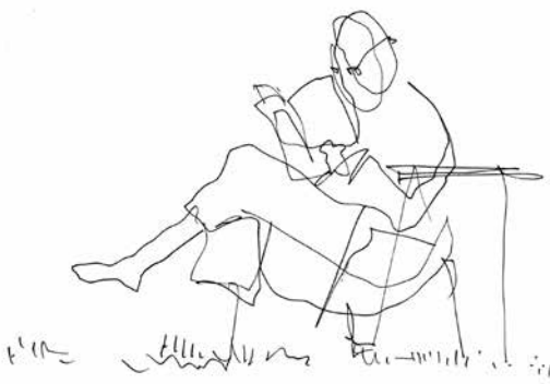
Kresba Michala Žáka

Tento kurz má za cíl prohloubit kontemplativní zkušenost skrze práci s tichem a vnitřní pozorností k tónům a zvukům. Budeme odkládat všechny zkušenosti s hudbou, abychom je našli jinak. Pro-